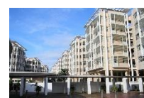
Hwa Chong Boarding Schoolの寮 (イメージ)